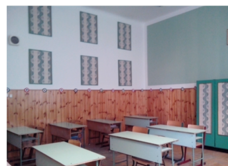
11. kép: Átalakult osztálytermünk 2015. március elején

a tehetetlenség átváltozik az uralom érzetévé, és a pszichikai energia nem vész el külső cél szolgálatában, ehelyett az Én-érzetet erősíti. Amikor egy tevékenység belső jutalommal bír, az élet már a jelenben igazolást nyer, és nincs szükség arra, hogy túszul ejtsék valami eljövendő képzeletbeli jutalom kedvéért. (Csíkszentmihályi, 1997, 50. old.)