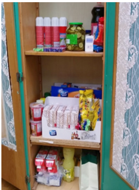
15. kép: Kávéházi szekrényünk árukészlettel feltöltve

jöhet, de csak a 3. szünettől, mert elő kell készíteni a terepet a vendégeknek. Kávéház kávé nélkül nincs, az a felnőtteké, de mit igyanak a kicsik? Teát, tejeskávét, habos kakaót, málnaszörpöt, limonádét! Mennyibe kerüljenek a finomságok? Honnan lesz kávéfőző? Mit egyenek? Kuglófunk nincs, de lehetne krémes, gofri, és persze hamburger, hot-dog! (Ez utóbbi lett a legnépszerűbb.) Honnan legyen rá pénzünk? Mennyit kellene erre köl-