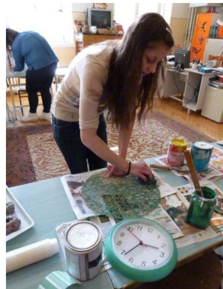
9. kép: Harmóniateremtés, dekorációs elemek átfestése

rögzítettük őket a helyükre és végül a szegélyléccel leszorítottuk, aminek a mázolásához találtunk némi arany festéket, ami illett a mintához és a reformkorhoz. Közben a terem egyéb látványelemeit is lefestettük a bekevert „szekrényzöld” színünkkel (9. kép).