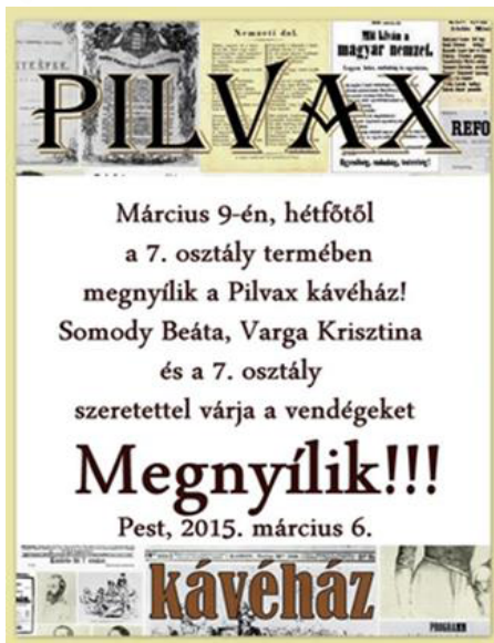
12. kép: Pilvax invitáció, saját grafikai tervezés