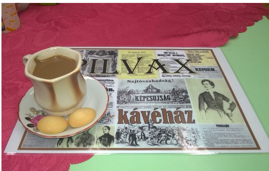
13. kép: Egy csésze kávé a Pilvaxban

Leültünk és azon gondolkodtunk, mire lenne szükségünk ahhoz, hogy itt vásároljanak a diákok és a tanárok. Mikor legyen nyitva a kávéház? Szünetekben természetesen, mert tanórákon senki sem