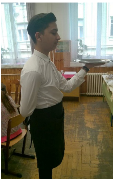
18. kép: Felszolgál a pincér

jöhet, de csak a 3. szünettől, mert elő kell készíteni a terepet a vendégeknek. Kávéház kávé nélkül nincs, az a felnőtteké, de mit igyanak a kicsik? Teát, tejeskávét, habos kakaót, málnaszörpöt, limonádét! Mennyibe kerüljenek a finomságok? Honnan lesz kávéfőző? Mit egyenek? Kuglófunk nincs, de lehetne krémes, gofri, és persze hamburger, hot-dog! (Ez utóbbi lett a legnépszerűbb.) Honnan legyen rá pénzünk? Mennyit kellene erre köl-