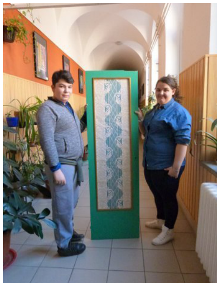
8. kép: Kész ajtótábla