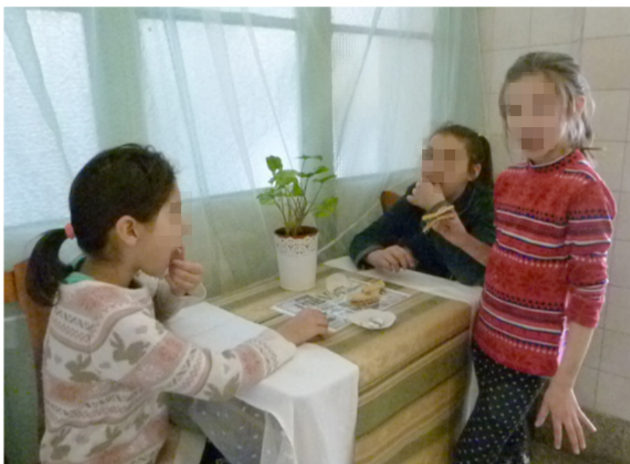
20. kép: 3. osztályos vendégek a kávéházunk „teraszán”, az osztályterem előtti folyosózugban

Kialakítottunk egy hangulatos teret, melyben jól éreztük magunkat, de rend, harmónia megőrzése nagyon komoly nevelési kihívás elé állított. Úgy tudtuk csak megőrizni és fejleszteni környezetünket, hogy újabb közös feladatot találtunk ki magunknak, majd mások kerestek meg bennünket és láttak el kreatív alkotói tevékenységekkel. Ilyen volt a szekrényünk inspirálta mese a MiraCOOLum megírása (1. kép), megrajzolása, animálása, vagy az MMA „Az élet Kincsesháza” művészeti konferenciáján az előadásunk és kiállításunk, majd az oktogoni Starbucks-sal közös kávéspohár tervezői projektünk, a médiába való