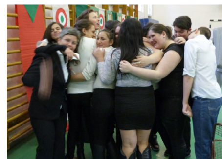
22. kép: Közös sikerünk megélése, a megérdemelt boldogság