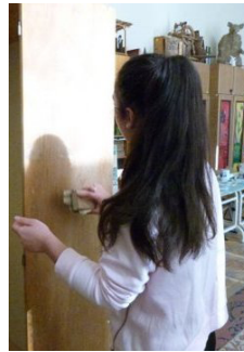
4. kép: Szekrény-csiszolás