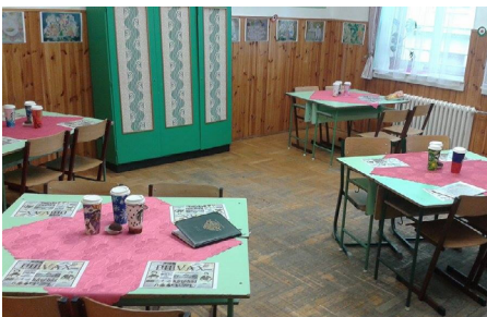
3. kép: A MI PILVAX KÁVÉHÁZUNK 2016 március 14-én, az egyedi tervezésű kávé poharainkkal az asztalon, melyet a Strabucks Oktogon céggel közös projektben hoztunk létre (2015 novemberében), a falon saját mesénk (2015 áprilisa) a MiraCOOLum animációjából fríz a printekből

Ennek a bizonyos szekrénynek az újjászületése indította el, majd tovább fejlesztette a további folyamatokat, melyet többszörösen összetett, sokrétű és igazán komplex feladatsorozat követett, amit három szakaszra tudnék bontani: I. Pilvax kávéházi projekt, II. MiraCOOLum (saját mese alkotása, majd kísérleti hangos képeskönyvé animálása (1. kép), III. Kiállítás sorozat (alkotómunkáink bemutatása 3. kép), e cikkben az első projektről írok részletesen.