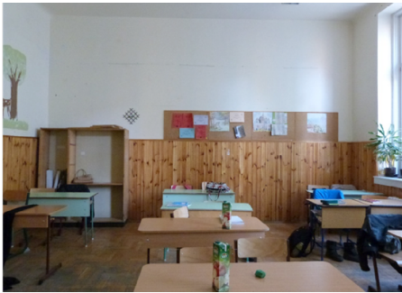
2. kép: Régi teremkép 2015 januárjában az átalakulás előtt