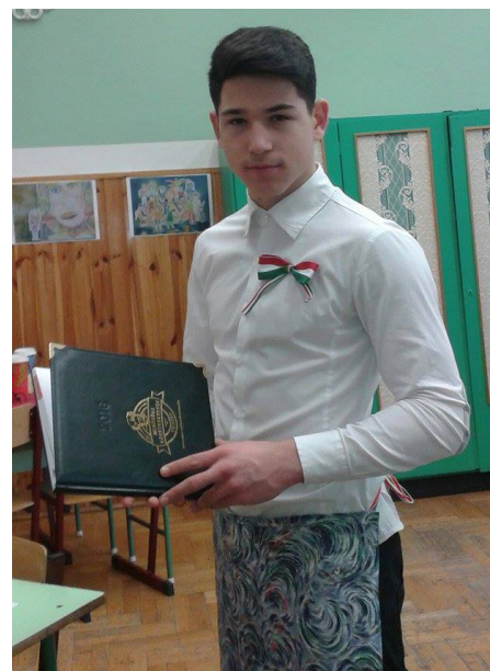
17. kép: Főpincér a számlagyűjtő „főkönyvvel” 2016. március 14-én

Megegyeztünk a terem kialakításában, a kiszolgálópultban és a kávéházi asztalokban. Az iskolánkban nem működött sulibüfé, így ezt a hiányt pótoltuk pár napra. Hétfőn megnyitottunk és 4 napon át működtettük, a kezdeti érdeklődést kedden már vásárlói kedv is követte, illetve a fogyasztást is pótolni kellett. Rájöttünk, hogy a bevételből még nincs nyereség, hiszen abban egyetértettünk, csekélyke pénzzel rendelkeznek a diákjaink, így ár-