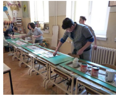
5. kép: Ajtóablák mázolás a rajzteremben