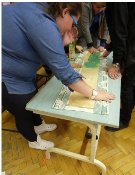
7. kép: Tapéta kasírozása az ajtó"tükörrre"