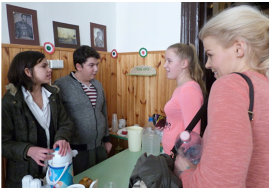
19. kép: Gimnazisták a kávéházban 2015. március 10., háttérben a korpépet idéző dagerrotípiákkal

Meghívtuk a második napunkra a szülőket, hogy jöjjenek be délután egy kávéra, végül csak egyetlen szülőt láttunk vendégül, de mi vele is jól éreztük magunkat. Vártuk a takarító néniket (őket ingyen vendégeltük meg), a gimiseket, az alsósokat és a felsősöket, valamint tanárainkat, akik azon a héten nálunk vásárolták a kávéikat a Pilvaxban (19. kép). A tanterem előtti folyosón kialakítottunk egy kis kiülős „teraszt”, mivel telházszal működtünk (20. kép). Semmit sem adtunk borsos áron, és néha kaptunk borralalót, amit beforgattunk a hiányaink csökkentésére. Rájöttünk pár nap alatt, hogy bizony nem fogunk ezen meggazdagodni, de rendesen elfáradunk és még az is lehet, hogy „nullára” se jövünk ki. Pedig nem számoltuk az egyéb költségeket pl. a fenntartást, a munkabért, áramot, tisztítószeret, de beszéltünk róla. A teljes működési projektet 3-4000 Ft mínusszal zártuk, mégis nagyon kifizetődő tapasztalattal gazdagodtunk, hiszen többen rájöttek, hogy a vendéglátásban szeretnének majd dolgozni cukrászként vagy pincérként. Kiváló és esélyteremtő pályaválasztási kísérlet volt. (Később általános