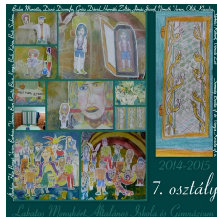
1. kép: Saját mesénk, a MiraCOOLum DVD borítója a szekrényrel

Az egyik legkomplexebb pedagógiai folyamatot, a Csíkszentmihályi Mihály által megfogalmazott áramlat-élményt élhettem, élhettük át az ide járó kamasz gyerekekkel 2015-16-ban. Akkor még nem is sejtettük, hogy következő céljainkkal, aktív, alkotó tevékenységeinkkel újra és újra visszakerülünk a flowba, és ezt, mint közösség tapasztaljuk meg, ráadásul az iskola falai között gondjainkat feledve. „Az áramlat-élmény egyik leggyakrabban említett velejárója az, hogy amíg tart, az ember képes elfelejteni az élet minden kellemetlenségét. Ez a tulajdonság annak az eredményeképpen jön létre, hogy az örömteli tevékenységek azt igénylik, hogy az ember teljes figyelmével az előtte álló feladatra koncentráljon - és így egyszerűen nem hagy helyet az elmében a fölösleges információ számára”. (Csíkszentmihályi, 1997, 43. old.)