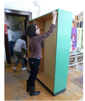
6. kép: Szekrényház festése