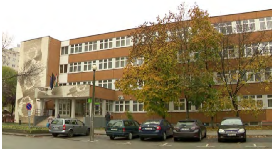
1. kép: Eötvös Gyakorlóiskola, Nyíregyháza

A mozgóképnyelvi tájékozottság és a mozgóképi szövegértés képességének fejlesztése érdekében az első nagy iskolai projektben a diákok hat tanórán keresztül jutottak el a mozgásfázisok kapcsolatán alapuló vizuális élménytől a némafilmek képi világát és kifejezőeszközeit megidéző kisfilmek készítéséig. A tanulók az élményközpontú tanórák keretein belül jártasságot szereztek a technikai eszközök használatában és az utómunkálatokhoz szükséges digitális eszközök, szoftverek alkalmazásában. A tematikai egységhez tartozó tanórák kiemelten fejlesztették a vizuális kommunikációs készséget,