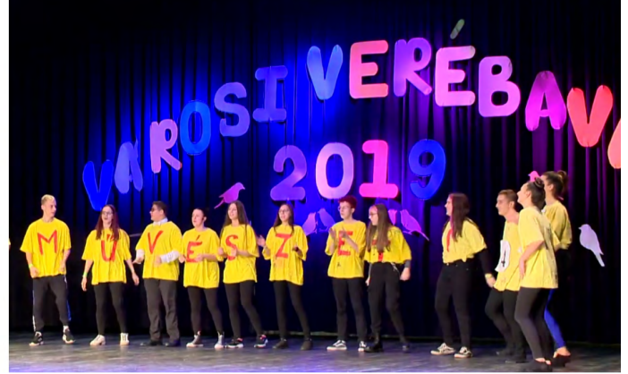
4. kép: Helyszínen készített képek

feladatokat oldanak meg, a rendezvény zárásaként pedig a kiemelkedően szereplő iskola diákjai elismerésben részesülhetnek.