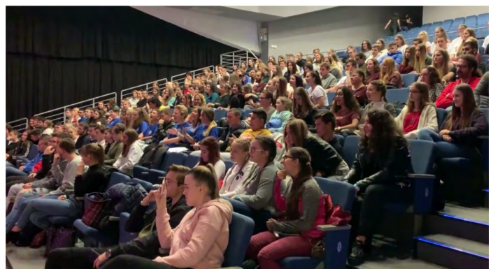
3. kép: Helyszínen készített képek