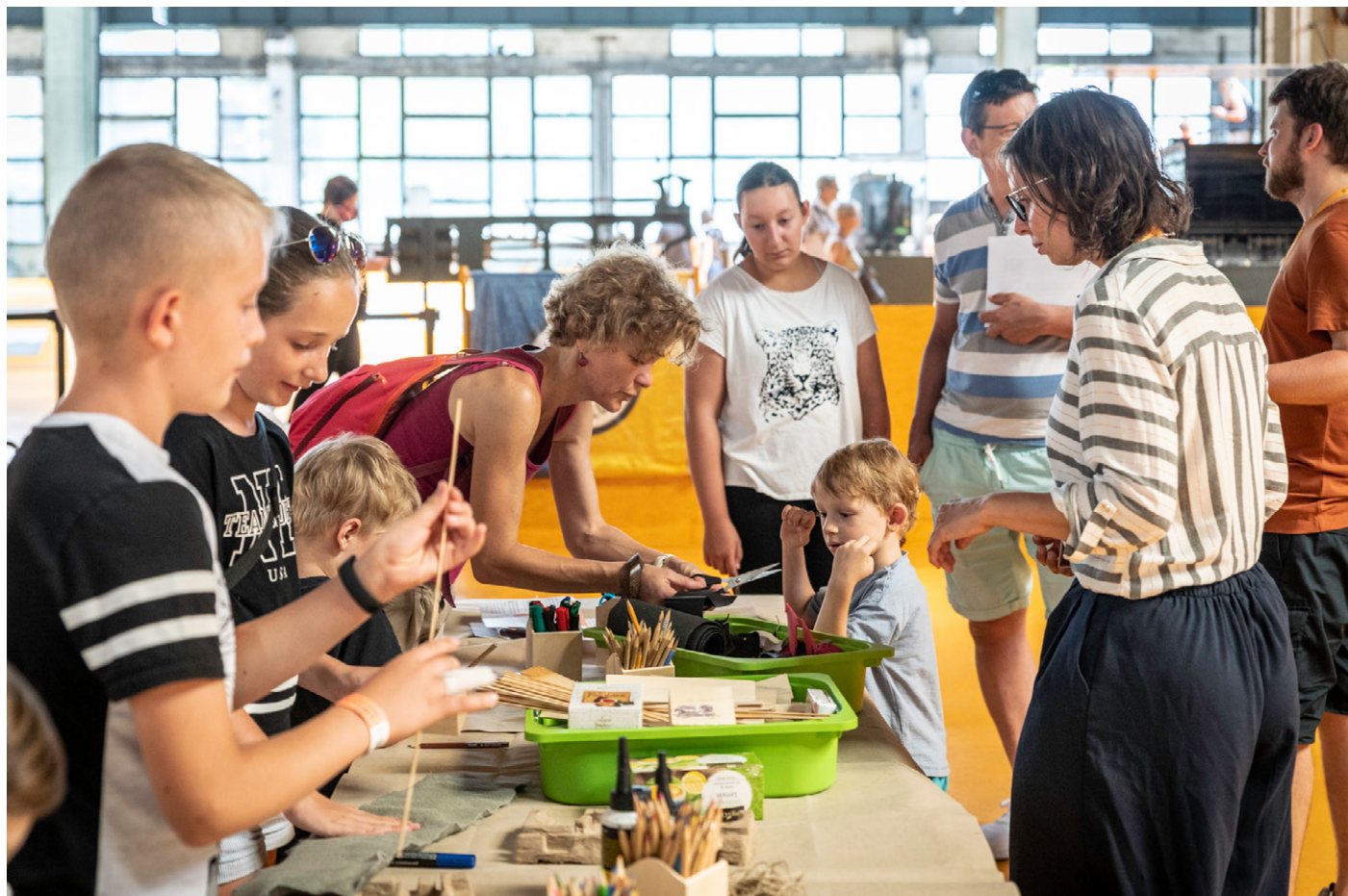
2. kép: Közös családi alkotások készülnek az Északi Járműjavítóban

csütörtökön 14-16 óra között tematikus alkotóműhely-foglalkozások segítségével, egyes érzékszerveik bekapcsolásával ismerhették meg a gyerekek és az őket kísérők a közlekedési eszközöket. A hangok, az ízek, a tapintás által érzékelhető tulajdonságok olyan új tapasztalatokat adhattak a már ismert közlekedési eszközök esetében, sőt még a kulisszák mögé is bepillanthatnak. Megismerhették egy múzeum működésének rendjét, egy kiállítás felépítéséhez hozzájáruló szakemberek munkáját. Mindez hozzájárul a múzeumi szocializációhoz, a későbbiekben a tudatos múzeumlátogató közönség felneveléséhez.