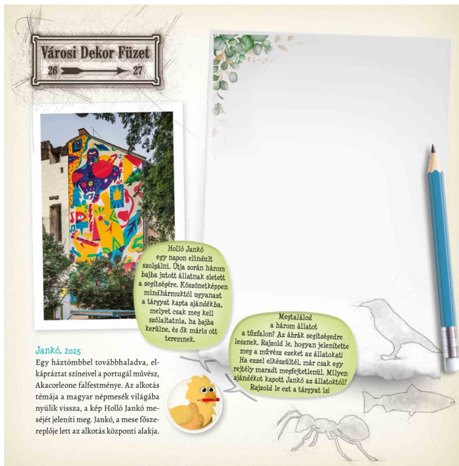
3. kép: Részlet a Városi Dekor Füzetből

A három program csupán csak íze-lítő a nyári szünetre kínált programok közül, a válogatás során szempont volt az eltérő hosszúság, pedagógiai és módszertani cél, a művészeti nevelés eltérő eszközkészletét és megközelítését