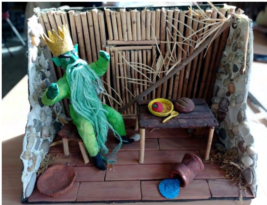
4. kép: A halászkirály (Csoport Mária munkája, 2019)

Tapasztalataink szerint a diorámák az oktatás minden szintjén használhatók. Meghatározhatják a tanulási folyamat egy-egy pillanatát, és segíthetik a megértés mélyebb szintjeit. A dobozba álmódott terek építése szórakoztató, kreatív módja egy háromdimenziós projekt megvalósításának. A trükk, a feladat sikeressége leginkább a témában rejlik. Fontos, hogy elég inspirációt nyújtson az alkotóknak, mielőtt kutatni, gyűjtögetni kezdenének, vagy nyisson meg további lehetőségeket egy már feldolgozott, ismerős