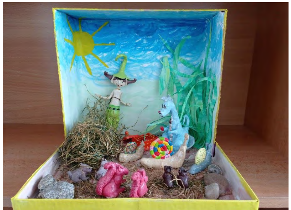
3. kép: A festő sárkány (hallgatói munka, 2019)