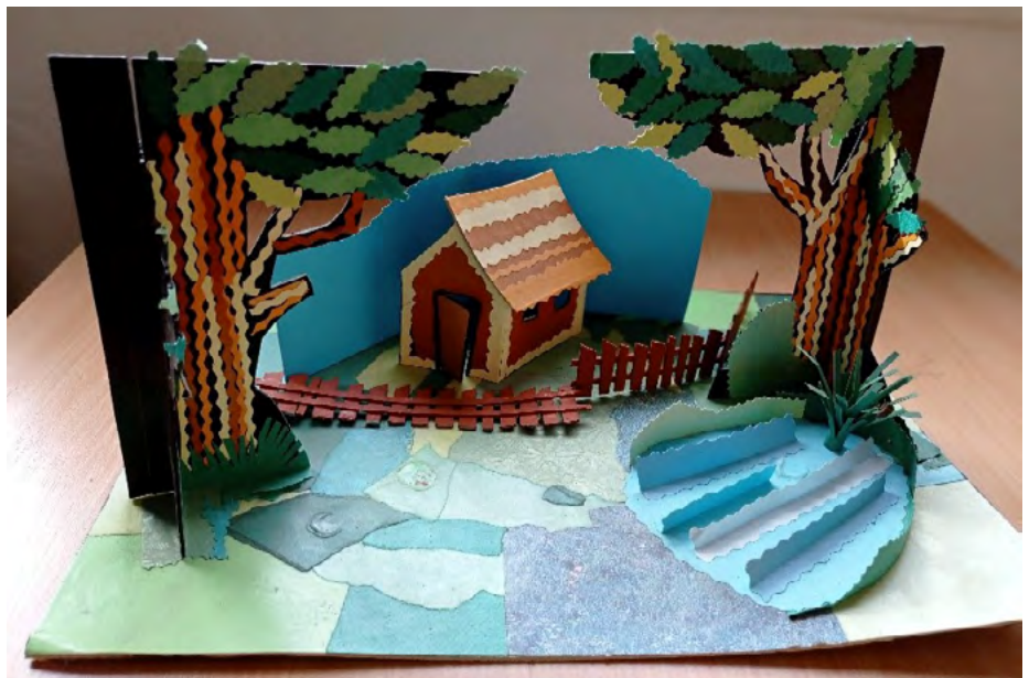
1. kép: Hallgatói munka, 2018

Dobozvilágok projektünk ezen szempontok mentén formálódik immár ötödik éve. A projekt keretében egymással összefüggő tárgyak, modellek és kivágott tárgyak háromdimenziós elrendezése valósul meg egy központi téma vagy fogalom illusztrálására, megjelenítésére. Cipősdoboz alapú diorámáinkat úgy értelmezzük, mint