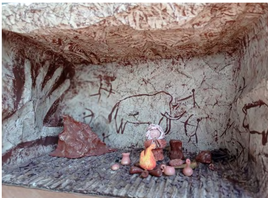
5. kép: Őskor (Komjáthy Zsuzsanna munkája, 2017)

témához. A hallgatók (ahogy a tanulók) újraalkothatnak egy történetet, kiemelve a kedvenc részüket, amit a legplasztikusabban tudnak megjeleníteni.