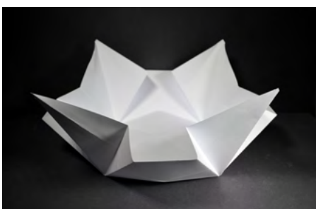
Party-tányér - papírplasztika

Fontos volt számomra, hogy az egyes feladatok bemutatása hasonló szerkezettel, jelrendszerrel, elrendezéssel és vizuális elemekkel történjen. Mivel nem készült tanári kézikönyv, ezért igyekeztünk