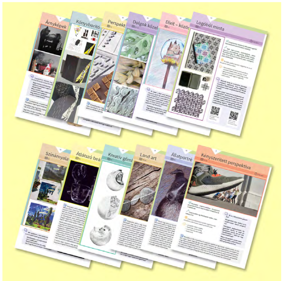
Lapok a kötetekből