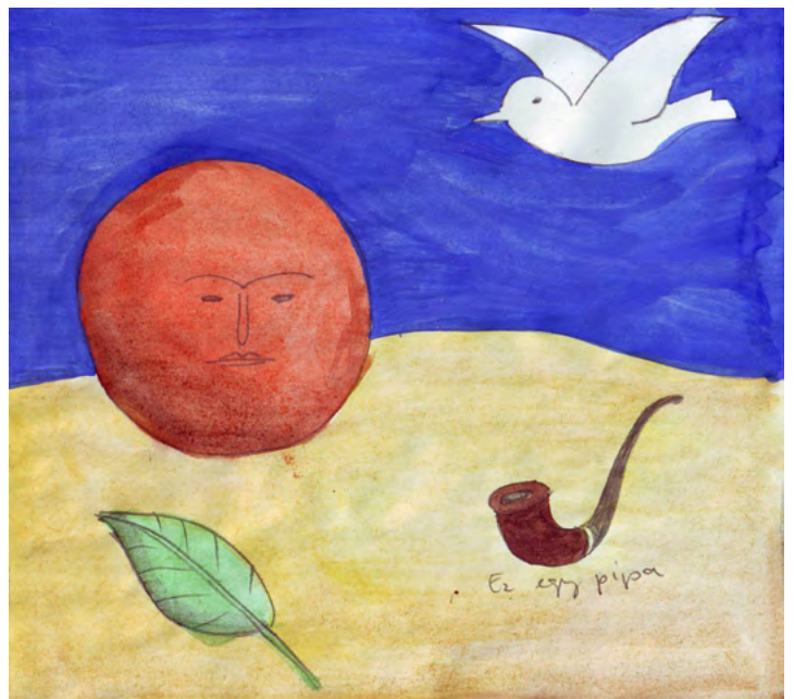
Dobj egy műalkotást - Magritte parafrázis - megoldás a táblázat alapján

Falra ragasztott csomagolópapíron készítettem egy halmazábrát (tárgyi részterületek és metszeteik), erre post-it cetlikkel elhelyeztettem a kedvenc feladataimat és a kinyomtatott, szétvagdosott kerettantervet, és addig-addig rakosgattam, amíg minden a helyére került és kitöltötte a megcélzott 72 órát. Ezt végigcsináltam