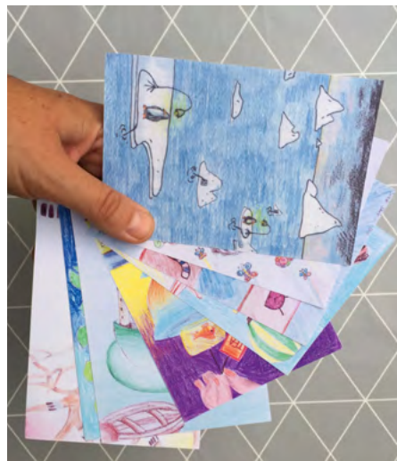
Dixit kártyák - színes ceruza