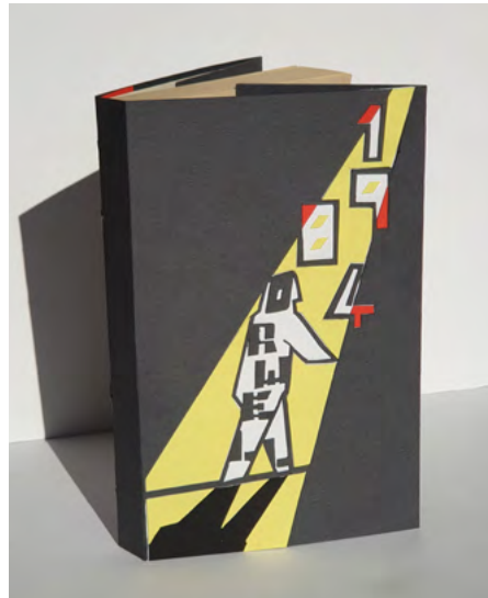
Könyvborító - Orwell 1984 c. könyvére

A tanár a feladatgyűjtemény és a diákok közötti médium, saját szakértelmét, háttértudását, csoportra és személyre szabott instrukcióit és korrektúráját adja az anyaghoz, ezáltal tud életre kelni, működni egy-egy gyakorlat. A vizuális nevelők, művésztanárok különböző szakmai háttérét figyelembe véve a feladatgyűjtemény egyfajta „receptkönyv” kíván lenni, amely teljességre törekvően instruál, de a tanár a saját megközelítése, „ízlése” alapján dolgozik. Kritikaként elhangzott, hogy túl sok a designnal és a térrel kapcsolatos aktivitás. Ez tudatosan van így, még hozzá azért, mert a tradicionális rajztanítás, az elérhető