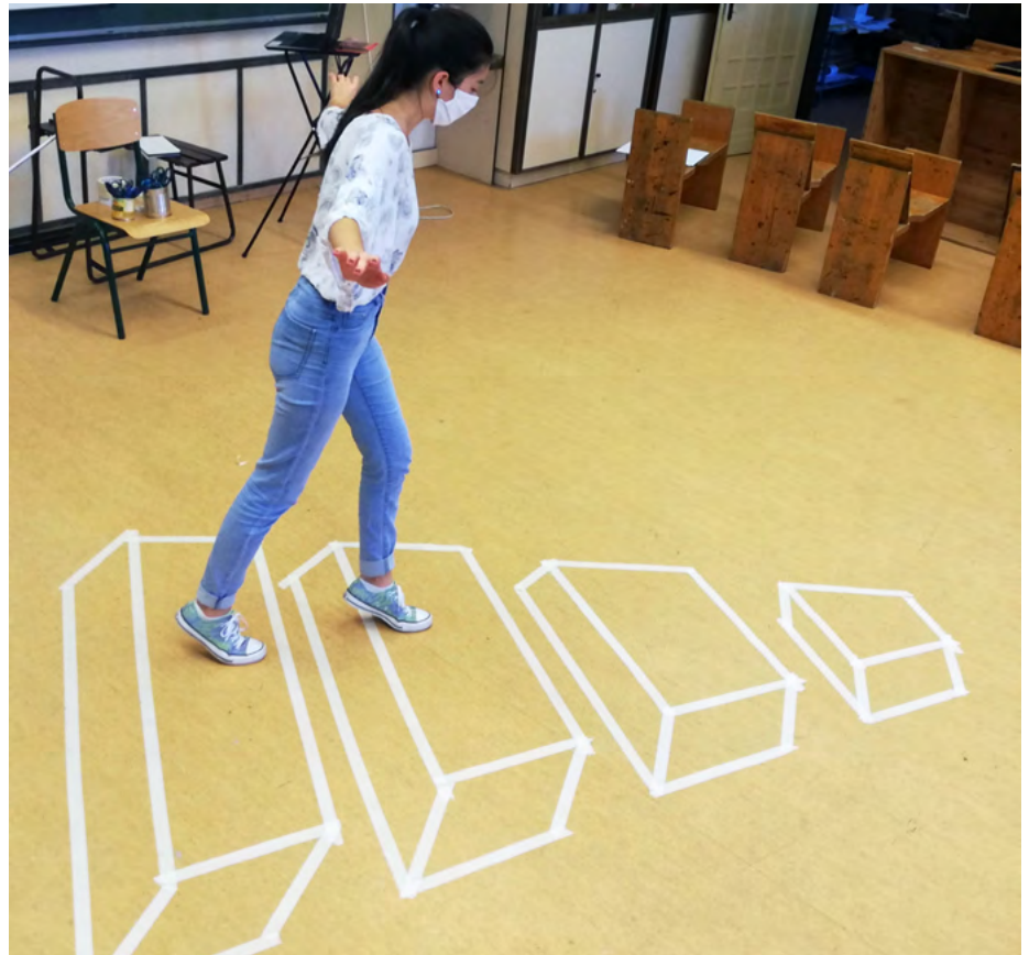
Interaktív képek ragasztószalagból

Sajnos az új NAT bevezetése miatt már csak a 11. osztályos kötet van a hivatalos tankönyvlistán, a 12. osztályos kifutó. Beszerezhető az iskolai tankönyvrendeléssel (csak a 11. osztályos), valamint a KELLO mintaboltjában és webshopjában (11-12. osztályos egyaránt). A négy- illetve hatosztályos gimnázium számára készült kötetek a borító kivételével egyformák, ez ne tévesszen meg senkit. A 12. osztályos kötet letölthető erről az oldalról . Akit érdekel a 11. osztályos is, kérem írjon nekem a zsuzska.meszáros@gmail.com email címre.