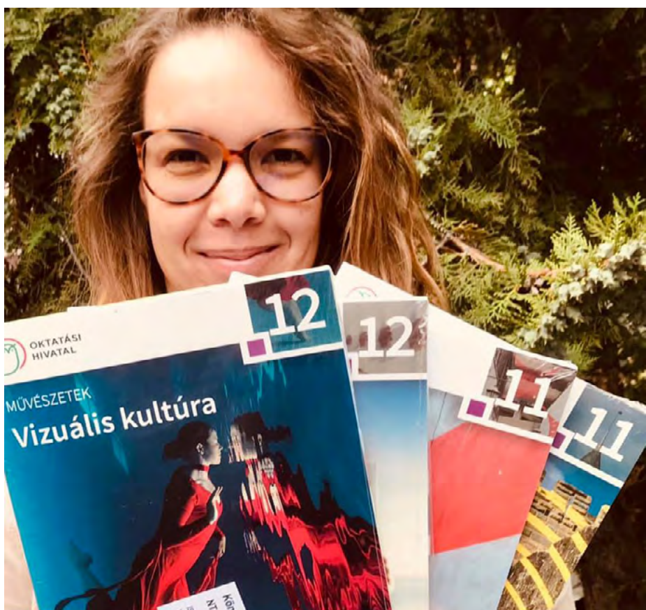
Fotó a szerzőről

Kihangsúlyoznám, hogy a kötet a 2020-as NAT életbe lépése előtt íródott, tehát még a régi kerettantervi célkitűzések figyelembevételével