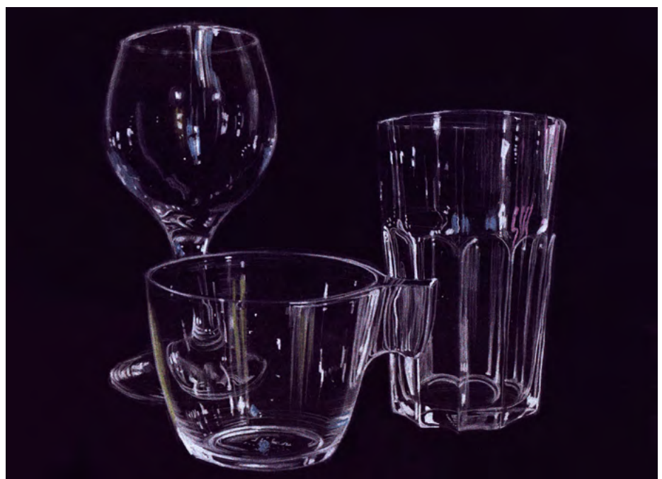
Átlátszó beállítás - ceruzarajz fekete kartonon