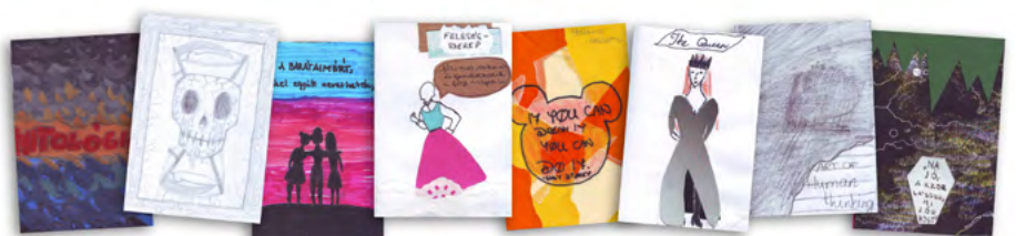
Zine - minimagazinok