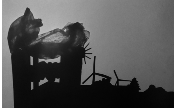
Árnyképek - fotó a tárgyak árnyékáról