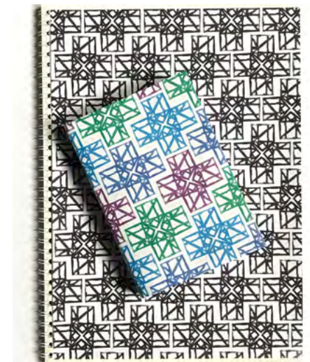
Logóból minta és füzetcsomagolás