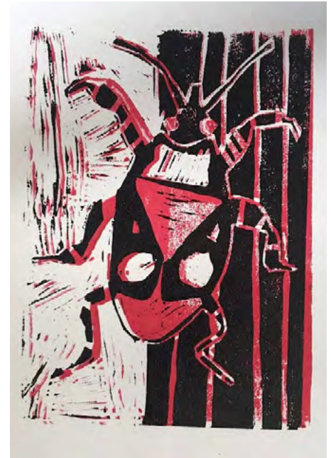
Kétszínű bogaras linó. Reduktív linó, 8. osztály.

Én nagyon szeretem a nyomtatásokat, fontosnak tartanám, hogy a gyerekek ezzel többet foglalkozzanak. Tudom, hogy technikai és anyagi gátak ezt korlátozzák, ez nem egy olcsó játék, ezért is csináltuk a reduktív nyomtatásokat . De dekorgumival vagy radírral is lehet nyomtatásokat készíteni. Szeretem a betűrajzot, játékot a betűkkel , mint például a betűbogarak , a névre szóló hópelyhek , vagy a bálványok a nevükből , ezt a legizgágább társaság is élvezni szokta. Szívesen használunk vegyes technikát illusztrációs munkákhoz, mint például a cirkuszos munkáknál. A szírkéta vízfestéssel rendkívül attraktív felületet ad. Évekkel ezelőtt csináltunk mimikris feladatokat , a lapra fel-festettek terepmintát vagy egy állat mintáját, a következő órán pedig rá-tették a kezüket, befestették ugyan-olyan mintára, és a végén lefotóztuk. A leghisztisebb gyerek sem állt neki nyafogni, hogy jaj, festékes lett a kezem! Egyszer éppen az első részét csináltuk meg egy osztállyal, de a második részre megbetegedtem, és helyettesített valaki. A gyerekek teljesen ki voltak kelve magukból, hogy nem tudják befejezni. Mondta nekik a kolléganő, hogy akkor próbáljuk meg. Bementek a szertárba, összeszedtek mindent, befestették a kezüket és végigfotózták. Úgy