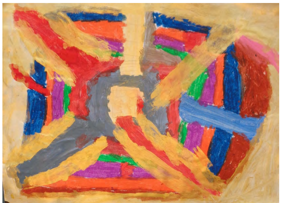
A kert, Hundertwasser után. Tempera