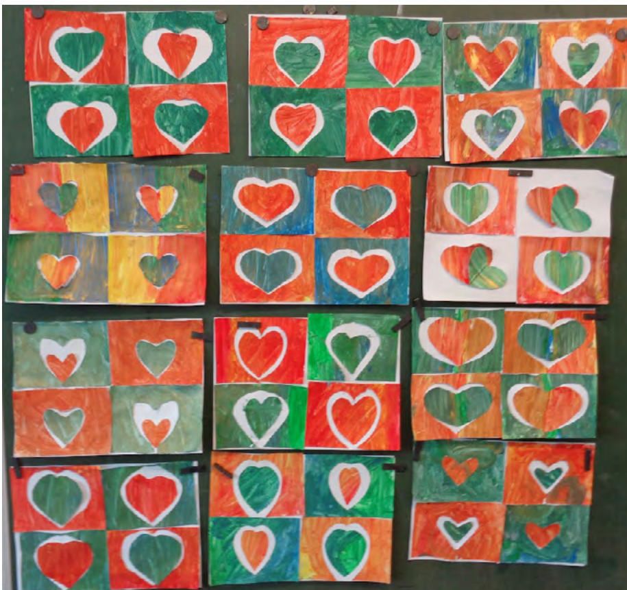
Szívek, anyák napjára Kandinszkij stílusában. Tempera, arany temperával megbolondítva, 5. osztály

Általában minden óra végén, illetve minden feladat végén, hiszen van, amivel 2-3-4 órát is foglalkozunk, például egy linómetszet lassan készül, a viaszkarckokhoz is két óra kell. Ki szoktuk rakni, táblára, földre,