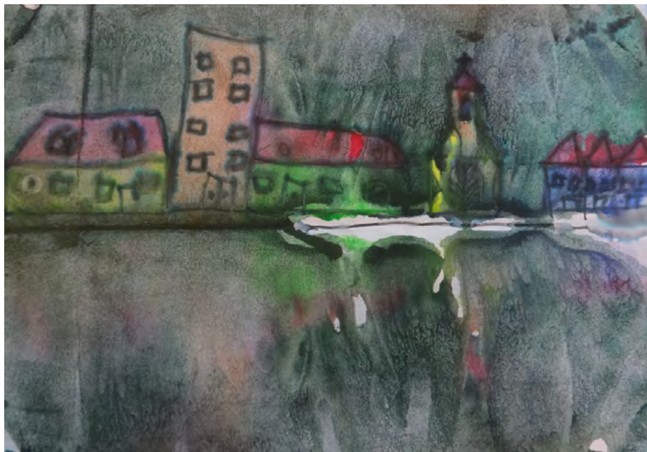
Eső után, a vizes utca. Vízfesték, filctoll, 4. osztály

Szeretik a rajzórát, de én is mindent megteszek, a legnehezebb anyagokat is valami jópofa feladatba csomagolom. Vannak olyan részek is, amiket inkább kihagyok, mert nem lesz rá szükségük. Azt szeretik, hogy sokféle technikával dolgozunk, és mindig van valami kis csavar a feladatokban, bár sok szervezéssel, pakolással jár a sokféle technika. Rajzszertáram van, rajztermem nincs, hurcolkodunk, pakolunk, rámolunk, kivisszük-behozzuk egyfolytában, a gyerekek bejárnak a szertárba. Üveg-szekrényeim vannak, ők megtalálják