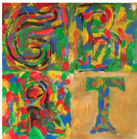
Monogram, Jasper Johns stílusában. Tempera, 6. osztály

Hogy most 11. osztályban kéne ki nyomni az egész anyagot? Próbálkoztam azzal, hogy kilencediktől kronologikusan vegyük, de szerintem az úgy elvész, elkopik a tudás, mire végzősök lesznek. Jobban bevált, hogy amúgy is minden órán vetítem nekik az aktuális anyaghoz kapcsolódó művészettörténeti példákat, mondjuk, ha ötödikesekkel múmiakoporsókat festünk csoportmunkában, akkor megnézzük egy kicsit az egyiptomi művészetet. Ha nagyobbakkal grafikát tervezünk, akkor például Mondriant megnézzük, mert ilyen jellegű munkát akarunk készíteni. Mindig vetíték nekik és el is mesélem, hogy épp mi az, amit látunk, ezzel a módszerrel meg is ragad bennük. De amikor „rendes” művészettörténet