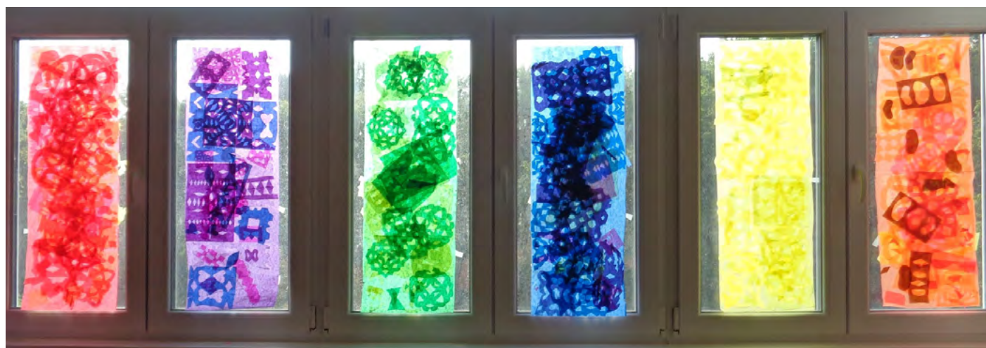
„Üvegkép” Transzparens papír, 5.osztály

A szakképzési alap vásárolja meg a felszerelést, így egészen remek dolgokat tudok velük csinálni. Eleve heti két rajzóra és egy divat- és művészettörténetet órára van velük. Viszont az a szomorú tapasztalatom velük, hogy vizuálisan képzetlenül érkeznek a 9. osztályba. Eddig inkább azt tapasztaltam, hogy a vidéki iskolákban mismásolják el a rajzórát, itt Esztergomban az általános iskolák nem voltak rosszak. Most viszont azt látom, hogy mintha eltűntek volna a rajztanárok. Olyan nulla előképzettséggel jönnek a lányok, hogy néha csak néznek rám, mint borjú az új kapura, ha mondok valami szakszót, fogalmat. Sok ilyen meglepetés ér. Nyafognak, de mindent megcsinálnak, a végén ők is élvezik a tevékenységet. Ez az első ilyen osztály, jövőre indul a következő. Azt szeretem benne – és általában a szakmában - hogy készülnöm kell rá, kutatni, kísérletezni, ezzel én is folyamatosan új dolgokat tanulok.