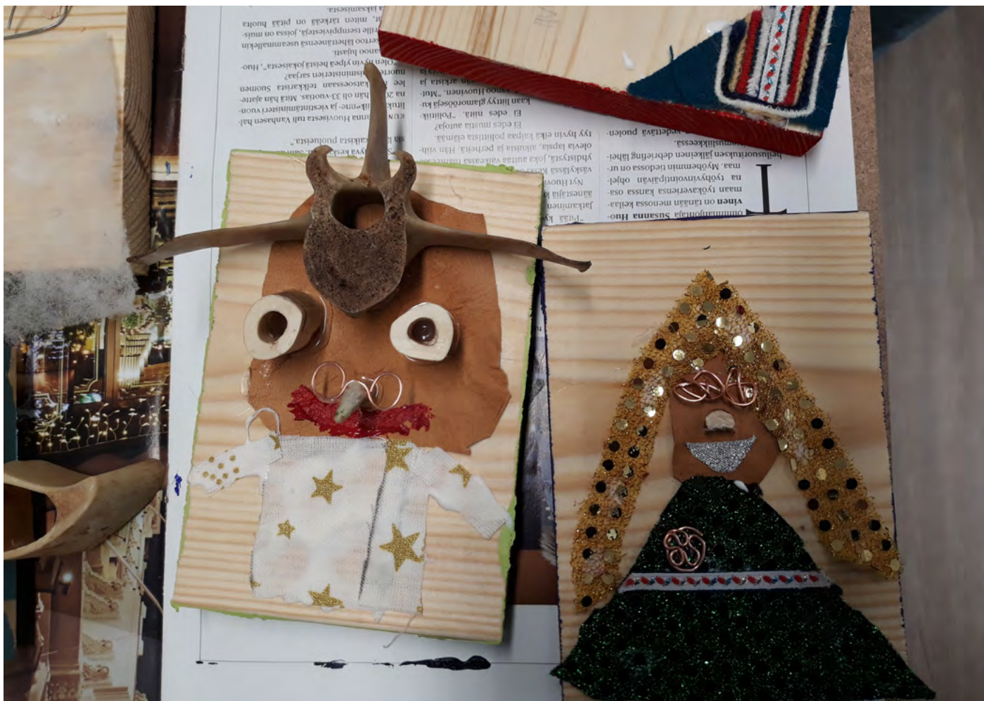
4. kép. A műhelymunka egy köztéri műalkotás elkészítésével fejeződött be "Ugyanabból a fából" címmel, amit az iskola zsbongójában helyeztek el. 2021

Az egész projektre kiterjedő értékelés leglényegesebb része a kommunikáció, a párbeszéd, és a közösség alapú tevékenységek voltak. A diákok tanulási tapasztalata az aktív tanórai munkából, személyes történetek elmeséléséből és a saját vélemény megfogalmazásából állt össze. Az elemi iskolás tanulók „végzetes történetei” egy jó pár méter hosszú színes rajztekercsen jelentek meg, az iskola zsbongójában