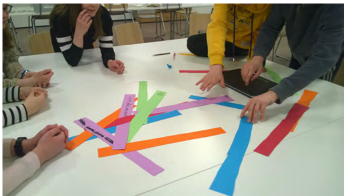
5. kép. Az elhangzó mondatokat eltérő színű kartonokra írták, és ezekből állt össze a szövegvékony. Fotó: Mirja Hiltunen, 2021

kifüggesztve. A médiamunkákat a záró eseményen mutatták be. A hét során készült összes munkát a készítőikkel együtt alkotott csoportokon belül vitatták meg. Ez az értékelési mód rávilágított a vizuális gondolkodás és alkotás fontosságára az etikai, esztétikai és ökológiai szempontok kétségbevonhatatlan érvényessége mellett. A résztvevők írásban is értékelték egymás és a saját munkájukat. Egy középiskolás így reflektált az alkotóhét tapasztalataira: