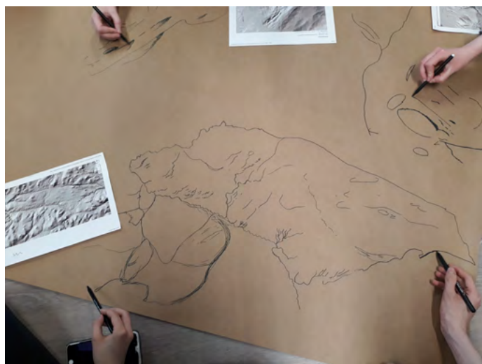
2. kép. A résztvevők különféle tollakat és színeket használtak az általuk választott helyre készített vázlatrajzhoz: a tanulási egység egyedülálló, személyes és közösségbe ágyazott elemekkel gazdagodott, amiket „Egyének a Közösségben” névvel illettek. Fotó: Mirja Hiltunen, 2021

A tanárképzős hallgatók által kezdeményezett művészeti gyakorlatok a fizikai tapasztalásra, a személyes képzetek előhívására és a hely szellemének emlékeire koncentráltak. A térképek elemzése során különös figyelmet fordítottak a tanulók sajátos szimbólumaira és képzeteire. A gyakorlatokkal az volt a célunk, hogy békés, otthonos hangulatot hozzunk létre, amiben mindenki szívesen dolgozik. Olyant, amiben mindenkinek a történetét, munkáját, vitáját támogatják