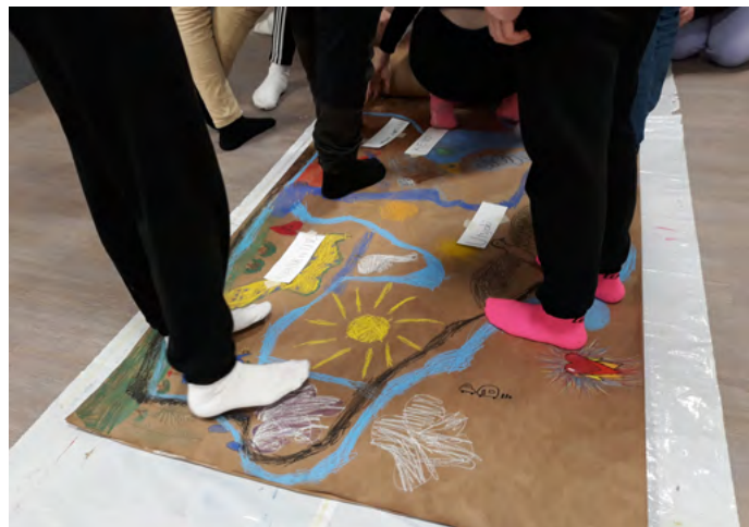
3. kép. A hely megtapasztalására készítő megbeszéléseket tartottak a térkép egyes elemeiről. A munkával egyidejűleg arra biztatták a diákokat, hogy beszéljék is meg a készítés problémáit, rukkoljanak ki a véleményükkel, és hallgassák meg másokét.

a kistanárok, de amelyekben a diákoknak nagyon nagy szabadsága van a tartalom kiválasztásában és a vizuális megjelenítés módjában. A résztvevőknek lehetősége nyílt arra, hogy elmondják a tapasztalataikat saját és mások környezetéről. A megbeszélésekhez egy feladatkiadó versikét fabrikáltak, ami kifejezte a tanulóknak a „végzetes” témával, a műhellyel és az egész héttel kapcsolatos érzéseit.