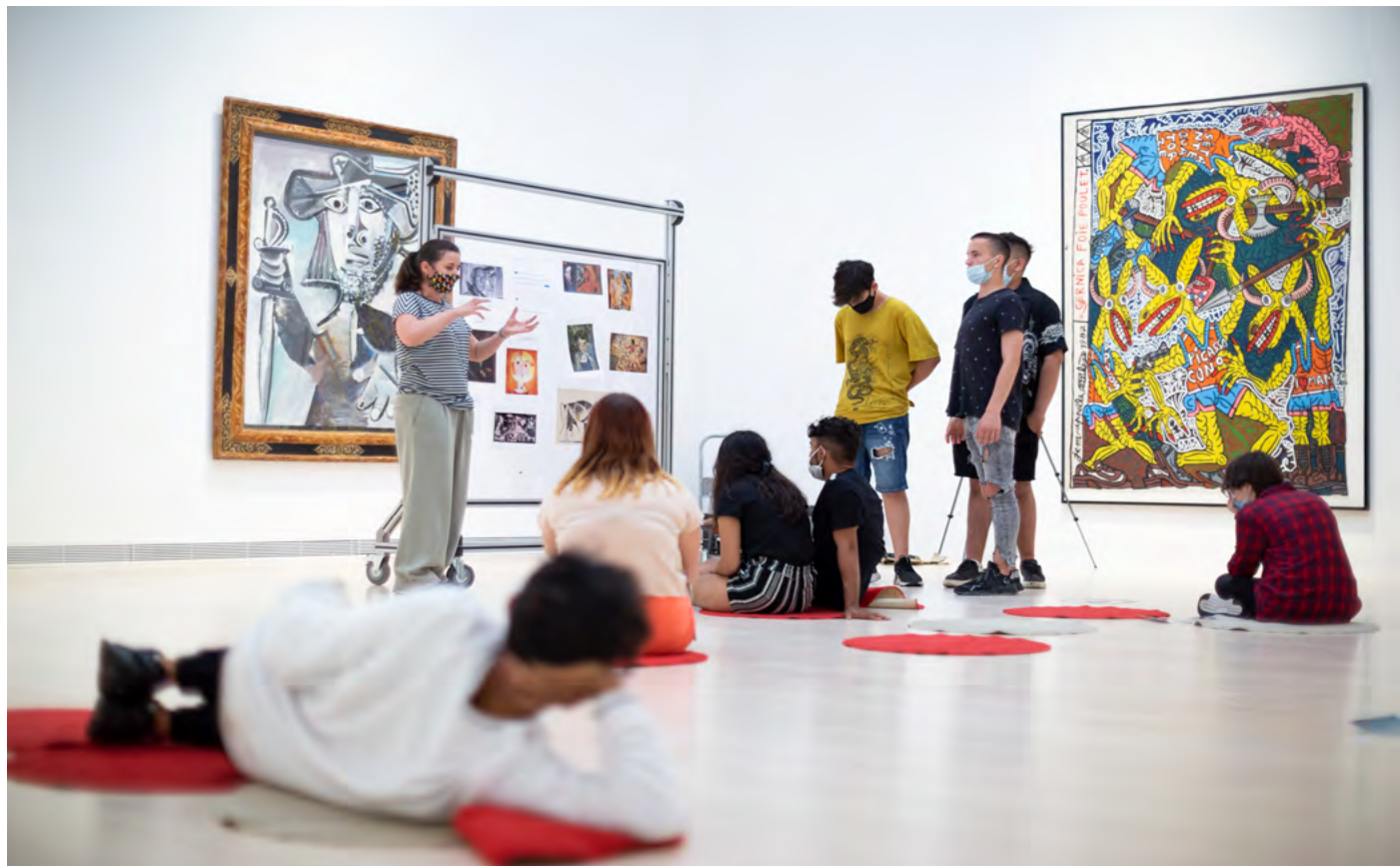
A kiállítóteret mobil osztályteremmé alakítva, a felbecsülhetetlen értékű Picasso festmények társaságában ismerhették meg a diákok a 20. század első évtizedeinek eseményeit.

Mit ér egy értékes művészeti gyűjtemény akkor, ha nem a közösség érdekeit szolgálja? Lélegzetelállító műveket gyűjteni, művészeket támogatni fontos szerepvállalás a kulturális életben, de hogyan lesz mindez mérföldkő az oktatásban? Talán ezek a kérdések foglalkoztatták a híres német műgyűjtő házaspárt, Irene és Peter Ludwigot is, akik 1989-es adományukkal megajándékozták az akkor még álló Vasfüggöny keleti népeit a kortárs művészet élményével.