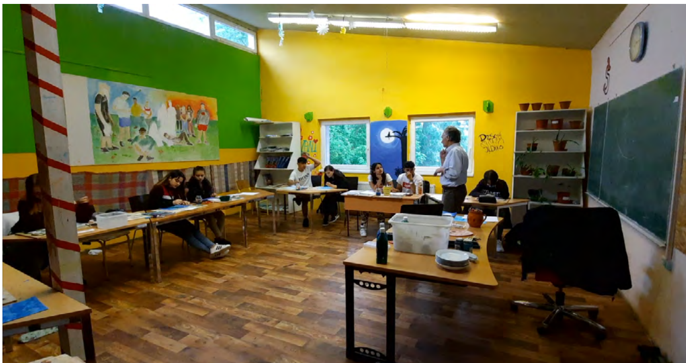
Tantermi óra a Burattino Általános Iskolában. Az előkészítő és feldolgozó órák, valamint alkotási folyamatok számára szabadon használható térben.

A slow looking (lassú nézés, szemlélés) módszere hasznos eszköznek bizonyult a műalkotásokkal való ismerkedésben. A feladat során a diákokat arra kérték a múzeumpedagógusok, hogy 5 percig megadott szempontok alapján figyeljék meg a műtárgyat. A megadott szempontok alapján írásban rögzíteniük kellett a megfigyeléseiket (műalkotás anyaghasználat, mit kérdeznél a kép szereplőjétől, milyen érzelmeket hoz ki belőled a mű) egyfajta sorvezetőként irányította a diákok figyelmét. A megadott öt perces időtartam még minden diák számára kezelhető időtartam volt, még a figyelemzavarral küzdő diákok is teljesíteni tudták a feladatot. A megfigyeléshez többféle stratégiát